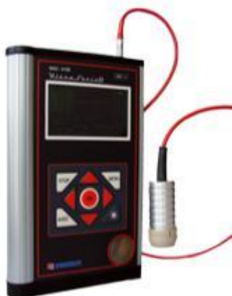
NKD - 019E UltraSonic