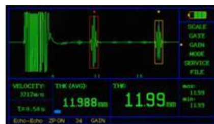
A - скан