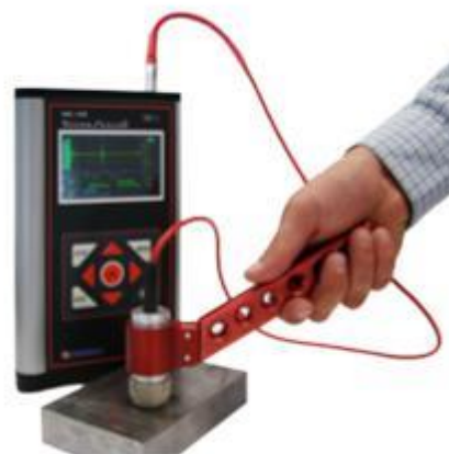
Измерение объектов с высокой температурой поверхности производится при помощи рукоятки