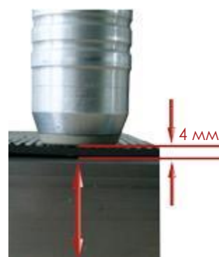
Измерение через неметаллическое покрытие